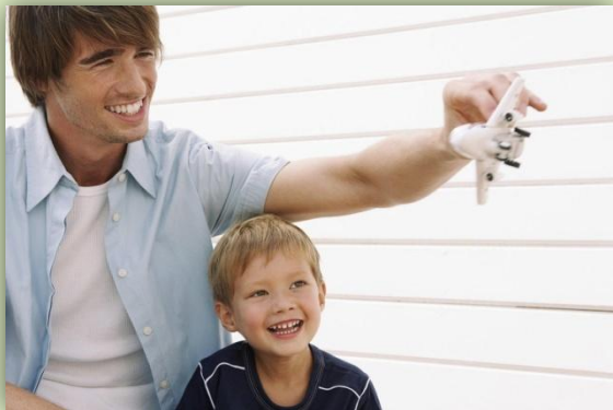
Семьи с детьми