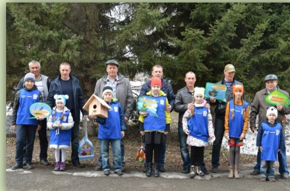
добровольческие отцовские отряды

активно принимавшие участие в конкурсе и марафоне «Папа открывает Мир» наиболее ярко проявившие себя предоставившие самые интересные, содержательные работы/отчеты о мероприятиях